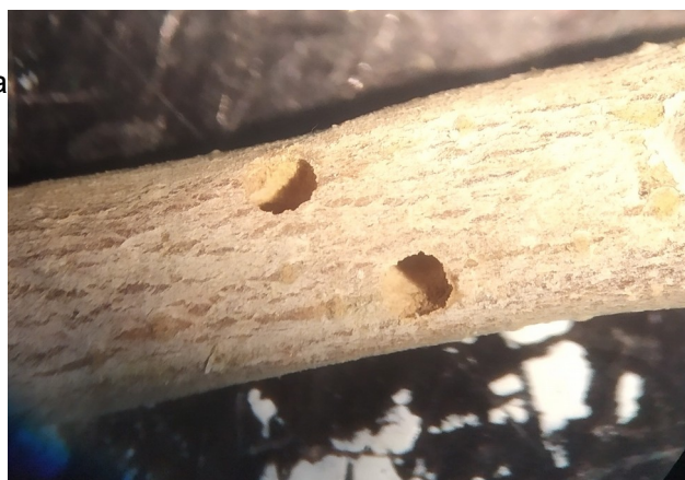
Agujeros de salida de Hylesinus

El tratamiento para el Prays carpófaga sirve también para el barrenillo negro