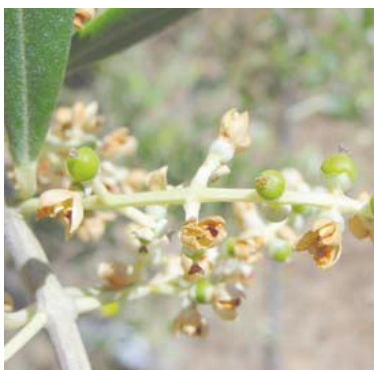
G Fruto cuajado

La totalidad de las comarcas están en fruto cuajado G , la comarca del Somontano se encuentra un poco retrasada y esta ahora en final de floración y fruto recién cuajado.