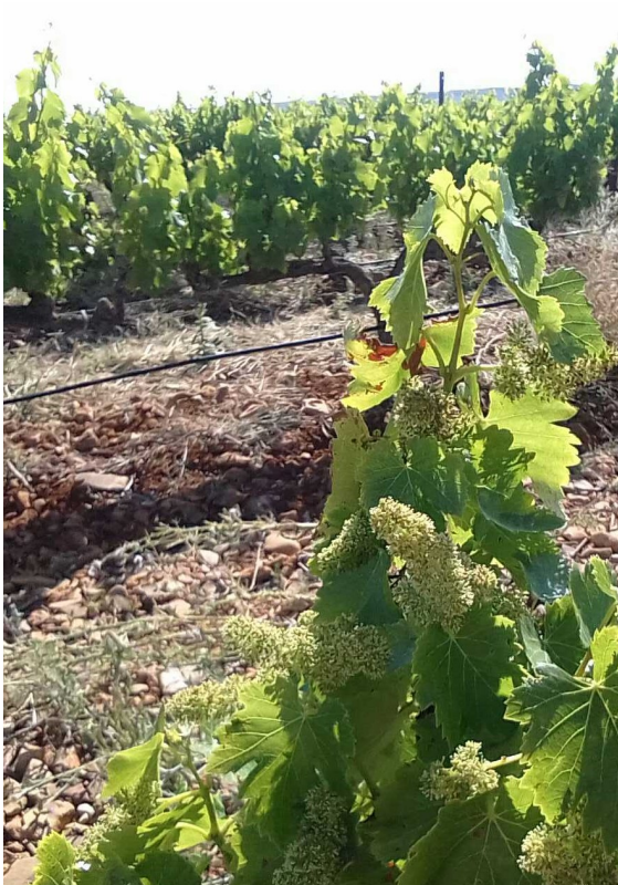
I2. 90% Plena floración. Más del 90% de flores abiertas. Garnacha en CARIÑENA MEDIA 28/05/2024