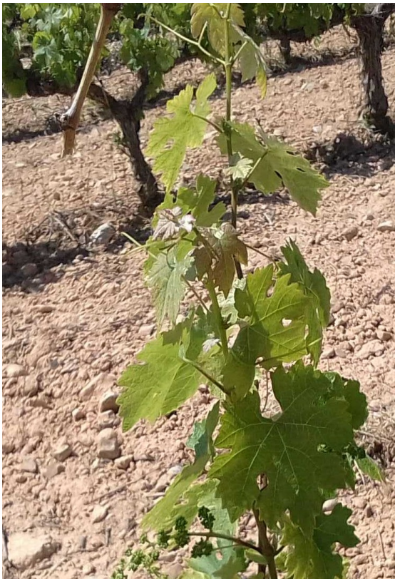
H12. Botones florales separados. Doce hojas separadas. Cabernet Sauvignon en Tosos (CARIÑENA ALTA) 28/05/2024