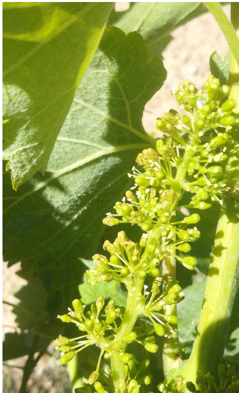
I2. 50% Plena floración. 50% de flores abiertas. Syrah en Paniza (CARIÑENA ALTA) 30/05/2024