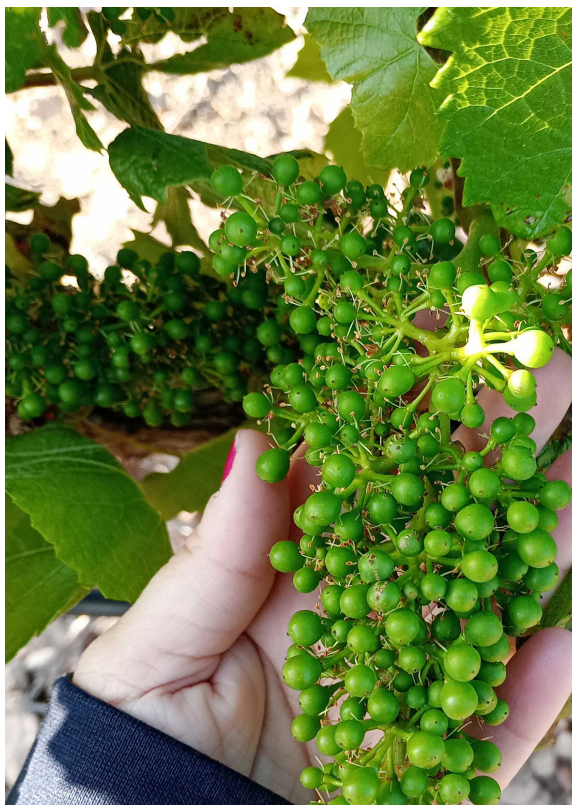
K. Grano tamaño guisante. Chardonnay en Magallón (BORJA BAJA) 31/05/2024