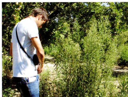
Conyza sumatrensis puede alcanzar una altura importante en buenas condiciones de humedad y fertilidad, como suele ser en la cercanía de los goteros de riego.

donde c es el límite inferior de la curva, d es el límite superior, e es la EC_{50} o lo que es lo mismo, la concentración efectiva que produce una respuesta a la mitad del valor del parámetro estudiado. En los estudios de resistencia esta EC_{50} se suele llamar LD_{50} para los datos de supervivencia o GR_{50} para los de biomasa y sería la dosis de herbicida que reduce un 50% la supervivencia o la biomasa de cada población. El parámetro b es la pendiente de la curva en su punto de inflexión. El ajuste ha sido realizado con el programa de software libre R, Versión 2.14.2 (R Development Core Team, 2014). Finalmente se calculó el factor de resistencia (FR) para cada