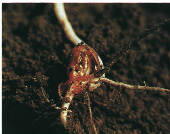
Fig. 4.—Destrucción de semillas.

P. platura inverna en el suelo en estado de pupa, apareciendo los primeros adultos