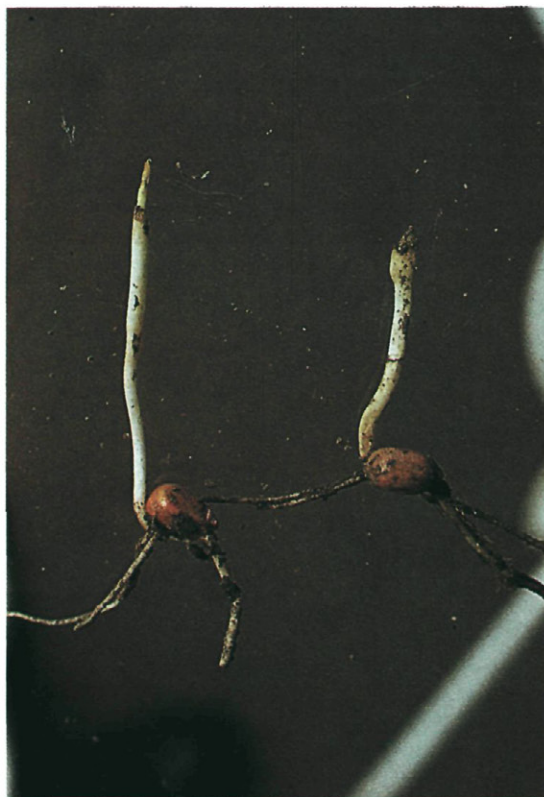
Fig. 5.—Daño en hipocotilo.

ya mediado el mes de abril. Las moscas sienten verdadera preferencia por los suelos húmedos y ricos en materias vegetales o animales en descomposición, sobre los que inicialmente las larvas pueden vivir y aún desarrollarse completamente. Una vez realizada la puesta en el suelo y tras un período de incubación de siete a ocho días (BONNEMAISON, 1980), las larvas recién nacidas sienten verdadera atracción por las semillas de maíz en período de germinación, en las que en fase de hinchamiento penetran comenzando su alimentación a expensas de ellas (figura 4). Esta penetración en la semilla puede ser múltiple ya que en el caso citado del pasado año se encontraron hasta seis y siete larvas en el interior de un mismo grano. Una vez producida la emergencia de