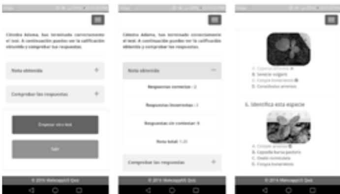
Figura 4. Pantalla final de preguntas y respuestas: (izquierda) ventana resumen; (central) resumen de calificación final; y (derecha) comprobación de respuestas.