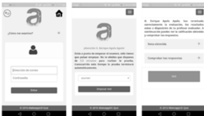
Figura 3. Pantalla módulo alumnos: (izquierda) pantalla de acceso; (central) instrucciones del examen; y (derecha) pantalla final.