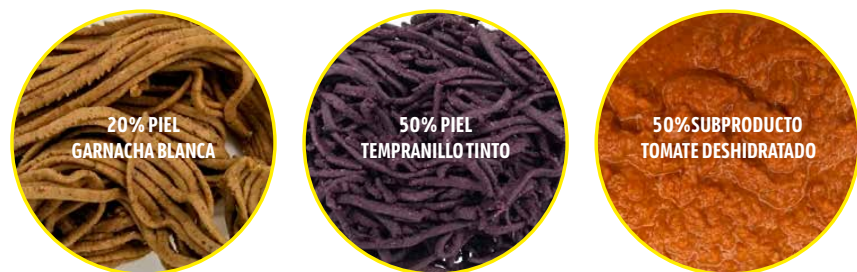
Figura 3. Pasta fresca elaborada con subproductos de hollejo y salsa de tomate elaborada con subproducto de tomate deshidratado

su atención en productos de base biológica, concretamente derivados de microalgas y cianobacterias emergentes como un recurso valioso para la producción y protección de cultivos, debido a su capacidad de biofertilización y su potencial bioestimulante. En el caso concreto de las algas, estos efectos se han atribuido