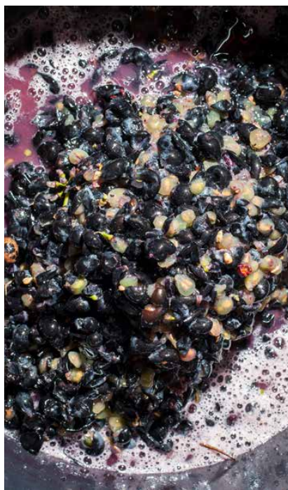
De los hollejos se pueden obtener subproductos tanto de la piel como de las semillas. Rafael Lafuente

para eliminar el agua por sublimación); 2) Secado por aire en estufa convencional a 40 °C y 60 °C, respectivamente; 3) Túnel de microondas en continuo, cuyo principio de secado se basa en la energía de microondas que actúa directamente sobre el producto dando lugar a un movimiento vigoroso de las moléculas del agua generando energía térmica que permite evaporar las moléculas de agua, por lo que la velocidad de calentamiento es muy rápida y la velocidad de secado se puede acortar para productos con contenido de agua por debajo del 30% y; 4) Sistema de secado con aire forzado a alta velocidad denominado Spiral Flash Dryer, cuyo principio de secado se basa en el contacto de las partículas del producto a secar con un flujo de aire caliente que asciende en espiral generando una alta turbulencia, lo que permite un secado muy rápido del producto (30-60 segundos).