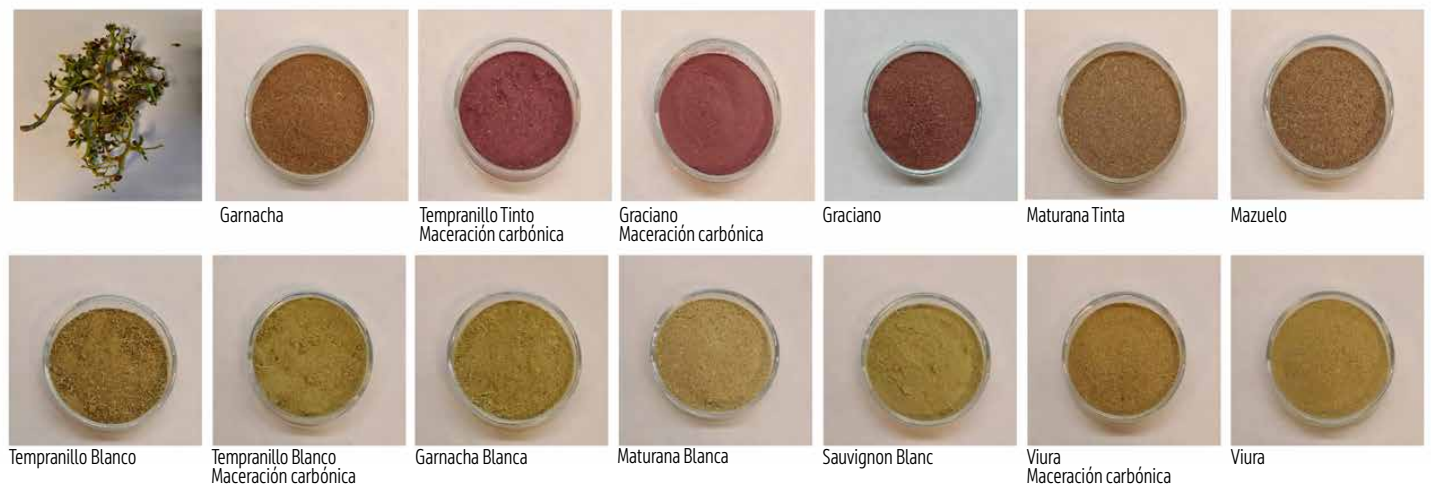
Figura 2. Ingredientes obtenidos de los raspones de diferentes variedades de uvas tintas y blancas

han seleccionado los procesos de deshidratación más adecuados para preservar los compuestos bioactivos que aportan valor añadido a estos subproductos. A partir de los ingredientes obtenidos, se han formulado diferentes productos a base de pasta y salsa de tomate como primera “prueba de concepto” que permite establecer una metodología de aplicación de estos ingredientes de alto valor añadido a la formulación de nuevos alimentos más saludables y con nuevos sabores y aspecto diferenciado.