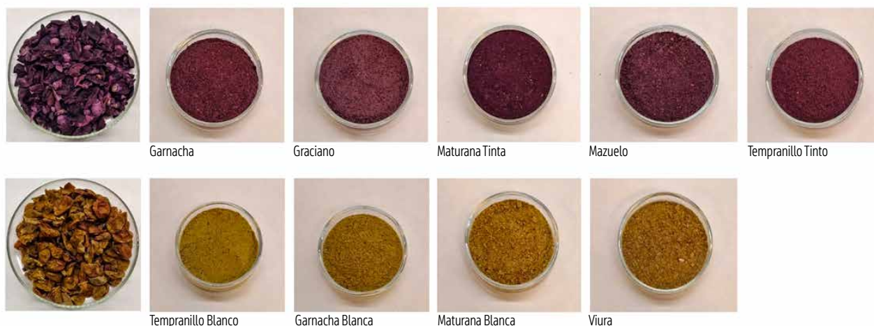
Figura 1. Ingredientes obtenidos de la fracción de piel de diferentes variedades de uvas tintas y blancas

ponsables de la estabilidad y astringencia del vino) y estilbenos (fundamentalmente derivados de resveratrol). Se ha observado que la fracción de piel de los hollejos de vinificación de tinto es una fuente importante de antocianos, que son los pigmentos responsables del color rojo, morado o azul en las uvas y en el vino. Estos compuestos se encuentran en la piel de la uva y se transfieren a mostos y vinos durante la maceración, siendo responsables del color en los vinos tintos, y se fijan por reacción con otros compuestos fenólicos a los que se unen formando polímeros y coloides. Además de su importancia en el color, los antocianos también tienen propiedades antioxidantes y antiinflamatorias beneficiosas para la salud humana.