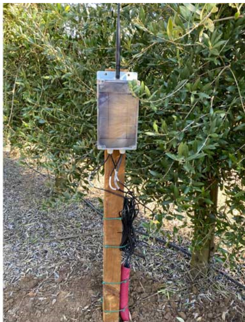
Figura 2. Nodo de comunicación desarrollado por la Universidad de Córdoba.

La tercera y última capa es la interfaz gráfica de usuario. Esta capa interactúa con la segunda mediante la API NGSI-LD a través del protocolo HTTP (Hypertext Transfer Protocol). Para su desarrollo se ha utilizado la librería de código libre ReactJS ( https://reactjs.org ).