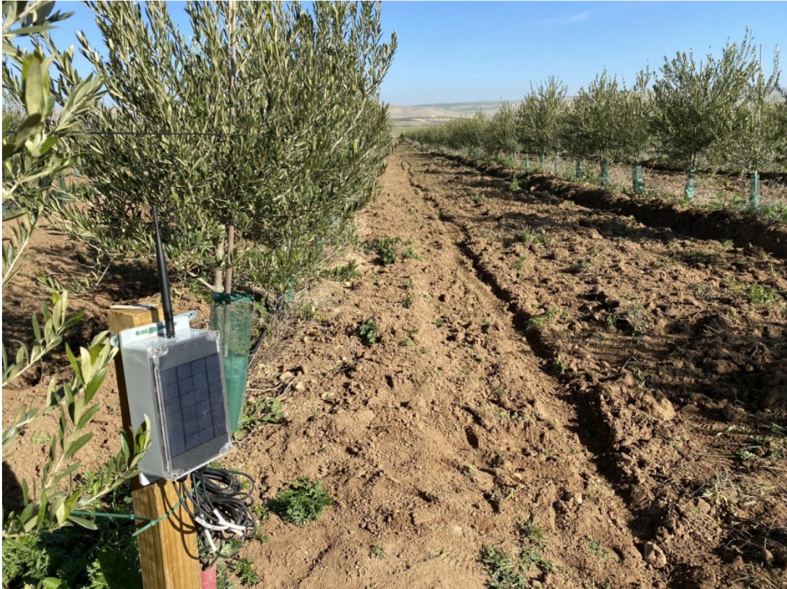
Sensor instalado en el olivar.

Tanto los datos medidos por los sensores como los resultados del algoritmo de riego se almacenan en tiempo real en una base de datos para posteriormente mostrarse en la aplicación de forma gráfica ( Figura 2 ).