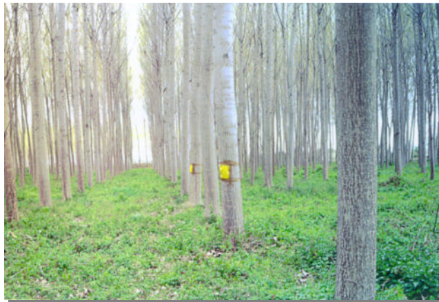
Foto 2. Trampas cromáticas