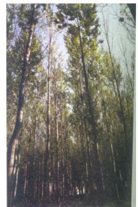
Foto 3. Paños en chopera