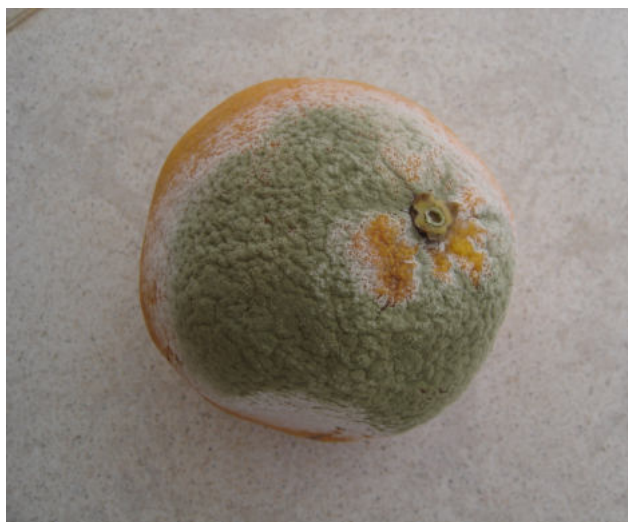
Naranja afectada por el hongo Penicillium digitatum . (Autor: Amílcar Marreiros Duarte)

tivamente la normativa aprobada y su adopción por parte de los productores, empacadores y exportadores. Esta normativa, si bien no se mantuvo en el tiempo, fue la base para la certificación EurepGap y posteriormente las GlobalGap que fueron los dos programas preferidos por los países importadores. En el caso de melocotón la producción se basa en las normativas de buenas prácticas agrícolas oficiales. Actualmente, los esfuerzos están enfocados en la obtención de frutos con bajo residuo de productos fitosanitarios, integrando un número variado de herramientas y prácticas que incluyen el uso de semioquímicos, tanto para el monitoreo como para el control, el uso de productos fitosanitarios de base biológica (virus de la granulosis y Bacillus thuringiensis Berliner var. kurstaki y var. aizawai ), el empleo de agentes de control biológico, el empleo de mallas y redes, así como el uso de agroquímicos de síntesis selectivos y de baja toxicidad.