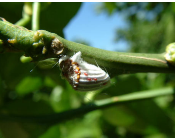
Cochinilla acanalada, Icerya purchasi , con huevos de su depredador Rodolia cardinalis . (Autora: María Teresa Martínez Ferrer)

químico para las principales plagas. Un ejemplo de esto lo constituye la captura masiva de la mosca de la fruta Ceratitis capitata (Wiedemann) (Buenahora y Otero, 2014) y la suelta de enemigos naturales para el minador de los cítricos Phyllocnistis citrella (Stainton) (Asplanato et al., 2009). También, en los últimos años, se han evaluado productos alternativos para el control de enfermedades tales como inductores de resistencia (Rubio et al., 2015), aceites esenciales (Lombardo et al., 2016; Pérez-Faggiani y Gimaraens, 2016) y otros controladores biológicos.