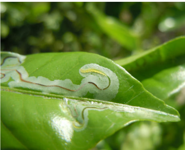
Minador de los brotes tiernos de los cítricos, Phyllocnistis citrella (Autor: José Miguel Campos Riveña)

En frutas cítricas, se elaboró un protocolo de PI para la región del río Uruguay en la década de los 90, con una actualización posterior (Rivadeneira et al, 2017). En el mismo se recomiendan, para el control de plagas y enfermedades, métodos biológicos, genéticos, culturales o físicos antes de proceder a la aplicación de agroquímicos. En caso de ser necesario su uso, se debe tener en cuenta la toxicidad para humanos, las dosis de uso, el plazo de seguridad, el efecto sobre enemigos naturales y la contaminación de aguas superficiales o subterráneas, entre otros aspectos (Anderson et al., 2017). La aplicación del protocolo de PI no es obligatoria y, en general, los citricultores se rigen por normas impuestas por los países compradores (fundamentalmente de la UE).