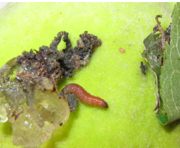
Larva de Cydia molesta , conocida vulgarmente como grafolita. (Autor: Jesús Avilla Hernández)

para el monitoreo y confusión sexual de plagas como Cydia pomonella L., C. molesta Busck y L. botrana y diversos productos en base a hongos y bacterias que son agentes de CB de múltiples enfermedades.