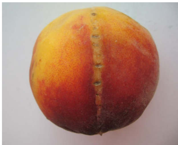
Necrosis en la sutura de un fruto de melocotón, causadas por Peach latent mosaic viroid

El manejo integrado de enfermedades se desarrolló más lentamente que el de las plagas, dada la complejidad tanto de diagnóstico de los agentes causales como de manejo de las enfermedades que estos producen. Actualmente, se utiliza una combinación de métodos y prácticas que se basan en prevenir la aparición de enfermedades y atacar puntos vulnerables en el ciclo del patógeno (Glass, 1975). La detección temprana