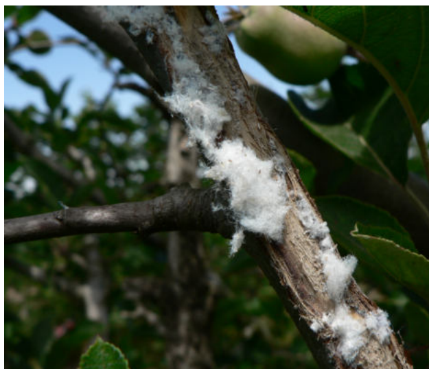
Síntoma de pulgón lanigero, Eriosoma lanigerum , en una rama de peral. (Autor: Lluís Battlori)

En los años 90 del siglo XX la implementación de la PI fue apoyada por el Estado, con subsidios proporcionales al área de implementación. También se contó con apoyo financiero para la contratación de técnicos responsables de la misma. Este apoyo, que era del 80% en el primer año y disminuía durante los