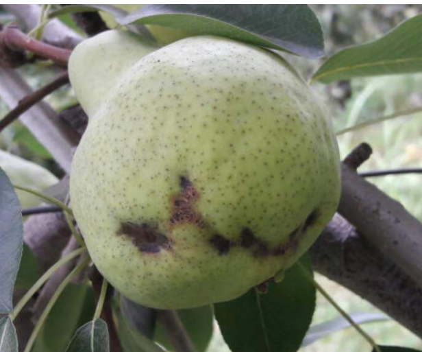
Daños de Venturia pyrina en pera Williams.

de plantas para la obtención de variedades resistentes (Stevens, 1960; Bhat y Srinivasan, 2002; Sanz-Carbonell, 2019). Todas estas herramientas se suman a las ya utilizadas, como las medidas culturales (selección apropiada de métodos de siembra, el uso de drenaje, riego, poda, sombreado, disminución inóculo, etc.) (Palti, 1981; Thurston, 1992; Ahuja y Kandhari, 2000) y el uso de plaguicidas, cuando está debidamente indicado (Fry, 1982).