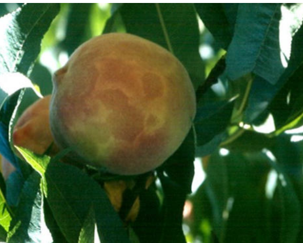
Anillos cloróticos en fruto de melocotón, causados por Plum pox virus raza D (Autor: Nicola Fiore)

desarrollo a partir de la incorporación de métodos de monitoreo basados en el uso de atrayentes alimenticios y sexuales y el uso de herramientas de control basadas en feromonas. A raíz de todos estos cambios tecnológicos y para atender demandas de los consumidores nacionales y extranjeros, el Ministerio de Agricultura, Pecuaria e Abastecimiento formalizó el desarrollo de las normas generales, los reglamentos y sistema de certificación de conformidad del sistema de PI de frutas. Esos documentos se publicaron en octubre de 2001. Las reglas cubren 15 áreas temáticas: (1) de formación, (2) la organización de productores, (3) los recursos naturales, (4) el material de propagación, (5) implantación de frutales, (6) nutrición de las plantas, (7) manejo del suelo, (8) riego, (9) manejo de la parte aérea, (10) protección integrada de la planta, (11) cosecha y post cosecha, (12) análisis de residuos, (13) procesos de producción, (14) sistemas de trazabilidad, cuaderno de campo, post cosecha e industria y (15) asistencia técnica.