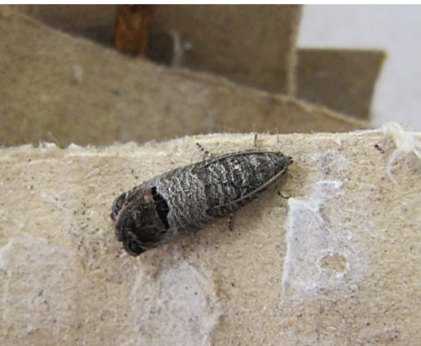
Adulto de carpocapsa, Cydia pomonella , el gusano de los frutos.

daciones del Codex Alimentarius (FAO, n.d.).