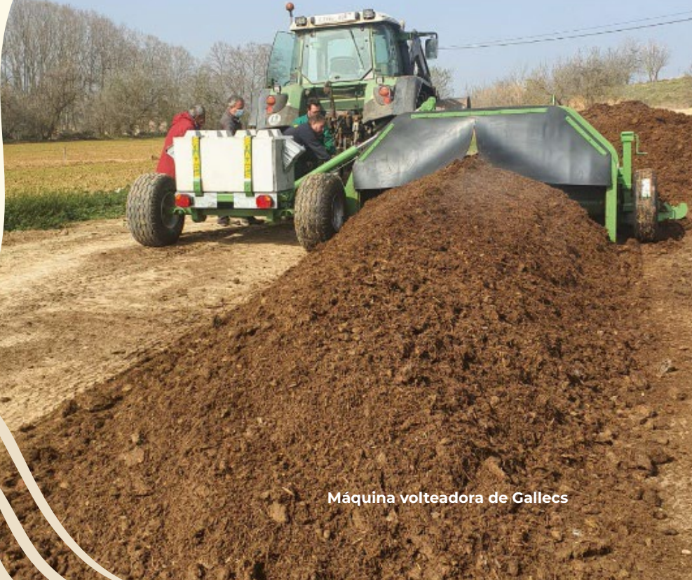
Máquina volteadora de Callecs