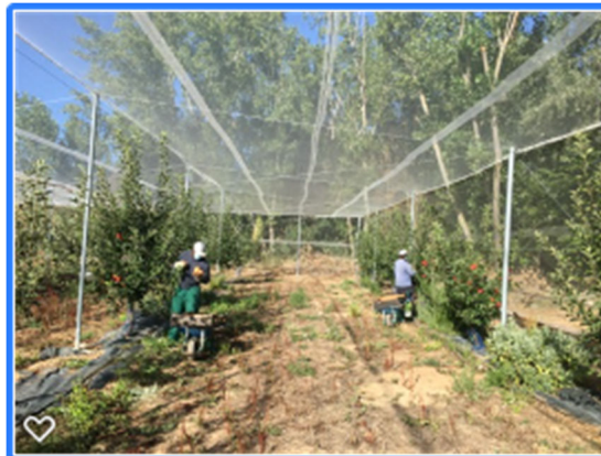
Figura 4. Colocación de malla antipájaros y antigranizo.

A su vez, la instalación de esta estructura proporciona además tutores para guiar y formar las ramas, al tiempo que puede servir de soporte para ramas con mucho fruto.