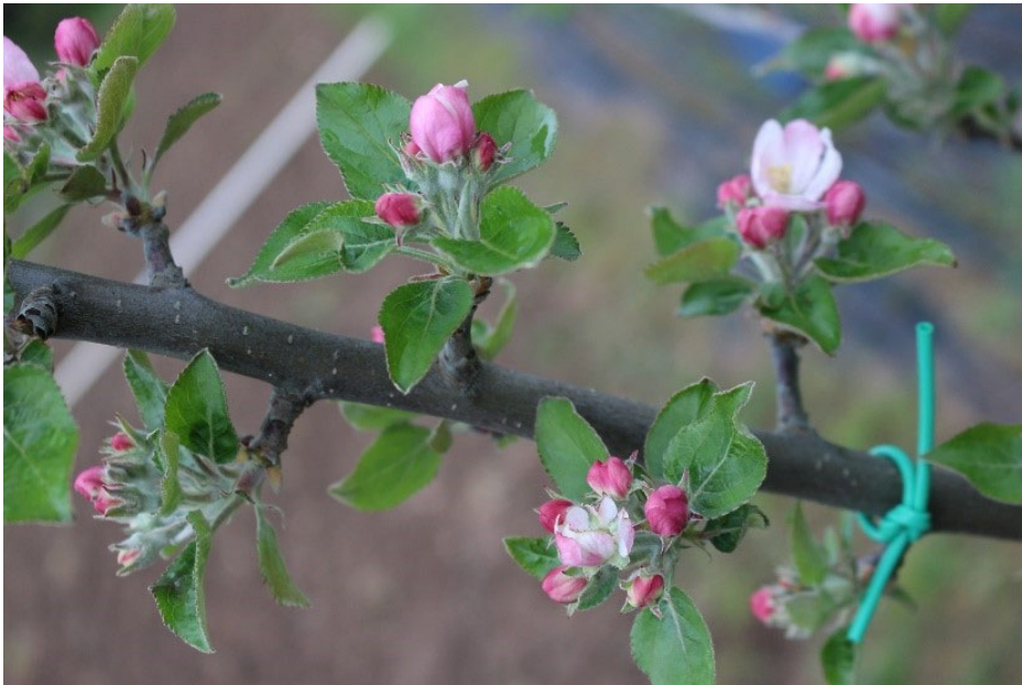
Figura 5. Estado de floración de las diferentes variedades el día 6 abril de 2020: Fuji (arriba izquierda), Royal gala (arriba derecha), Golden (abajo izquierda) y Reineta (abajo derecha).