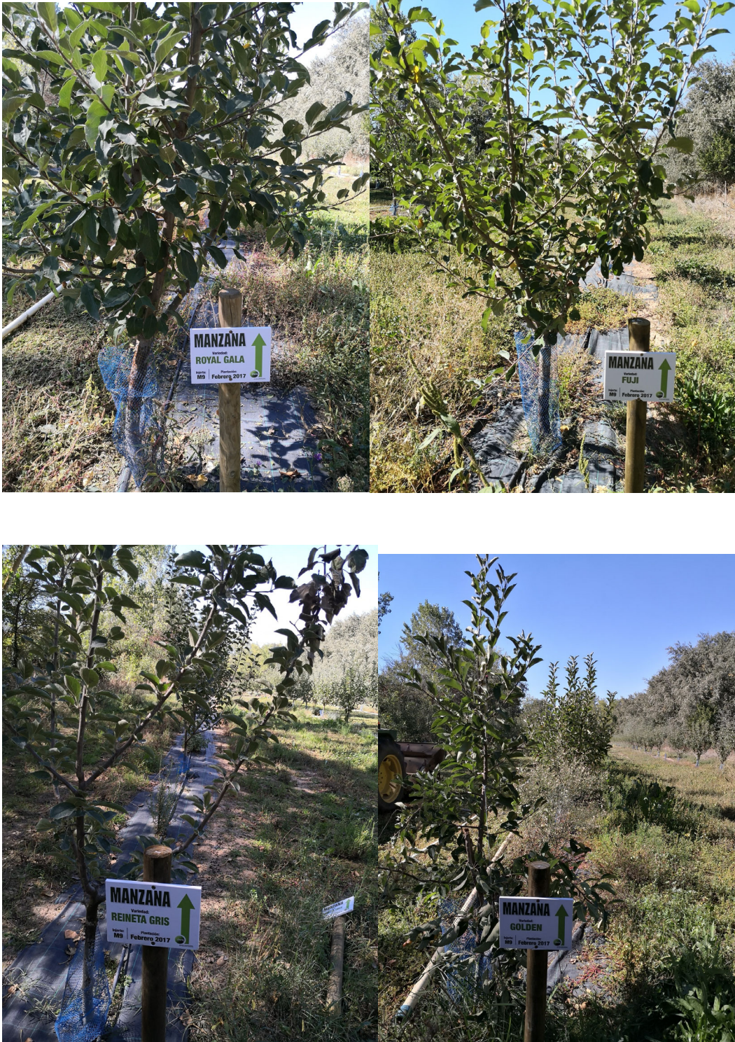
Figura 2. Imagen de las 4 variedades implantadas: Royal Gala, Fuji, Reineta blanca y Golden.

También se han implantado diversas plantas aromáticas en la línea de plantas: salvia, romero, etc a fin de que faciliten la polinización y sean alelopáticas ante la presencia de enfermedades.