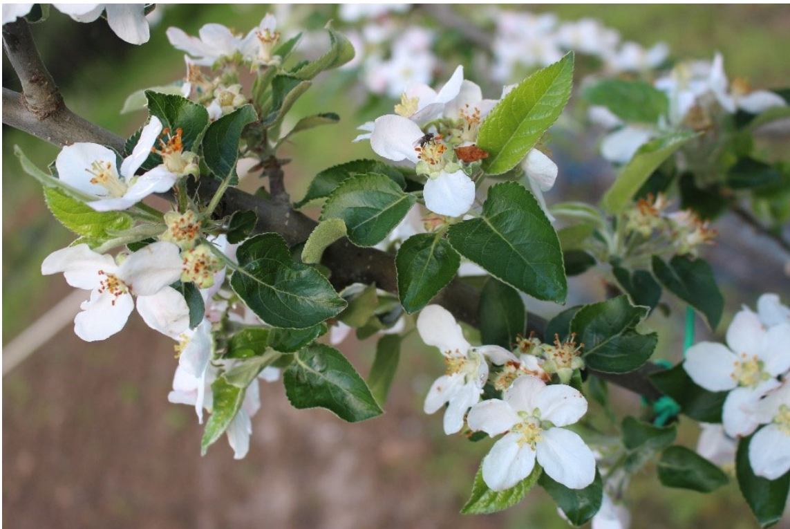
Figura 6. Estado de floración de las diferentes variedades el día 14 abril de 2020: Fuji (arriba izquierda), Royal gala (arriba derecha), Golden (abajo izquierda) y Reineta (abajo derecha).

Los árboles fructificaron bien y fue necesario hacer un clareo básico para no agotar al árbol y que los frutos no quedaran demasiado pequeños.