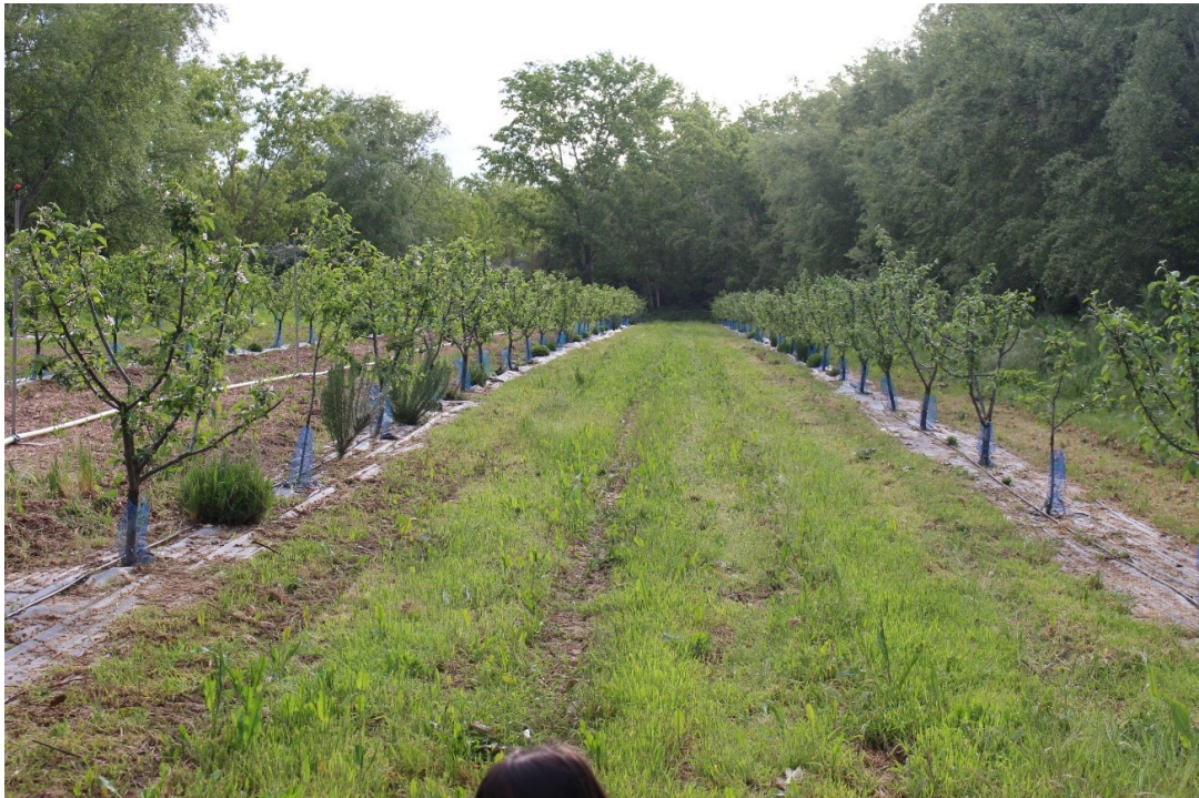
Figura 8. Calle con cubierta natural segada.