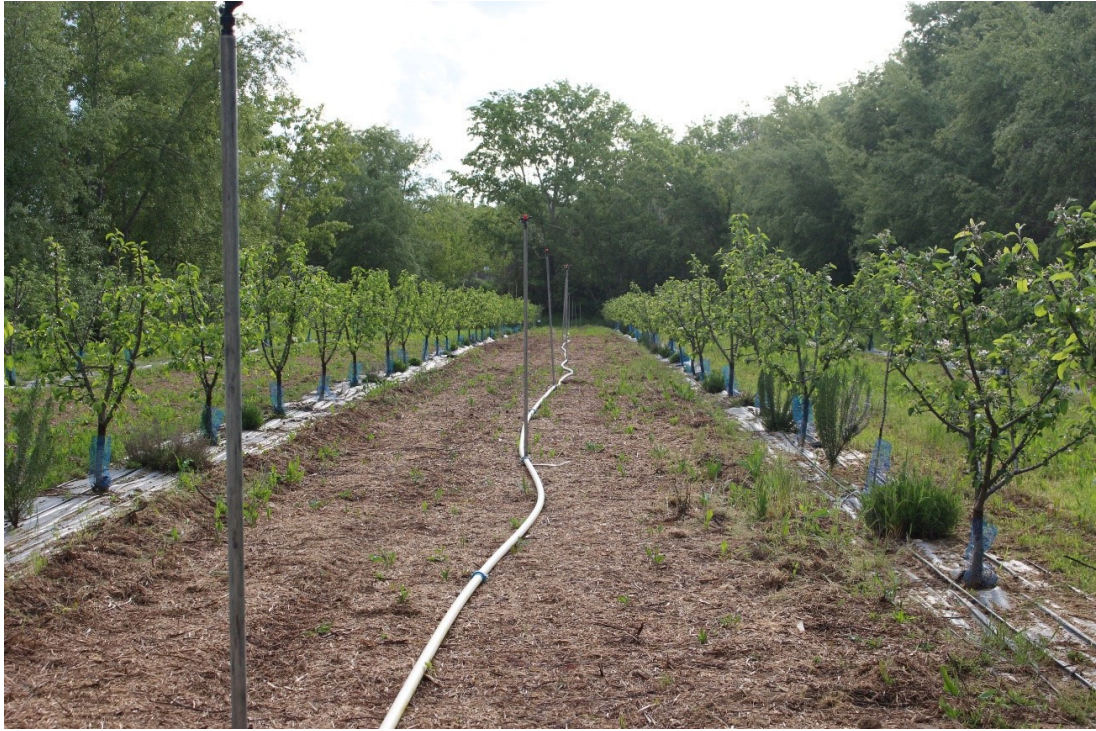
Figura 7. Cubierta con restos de poda urbana (capa de unos 12-15 cm).