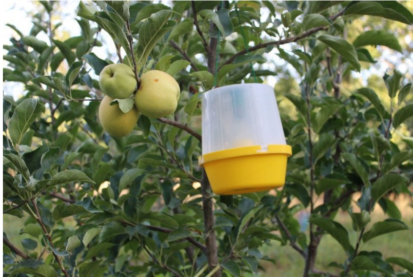
Figura 3. Trampas de feromonas.