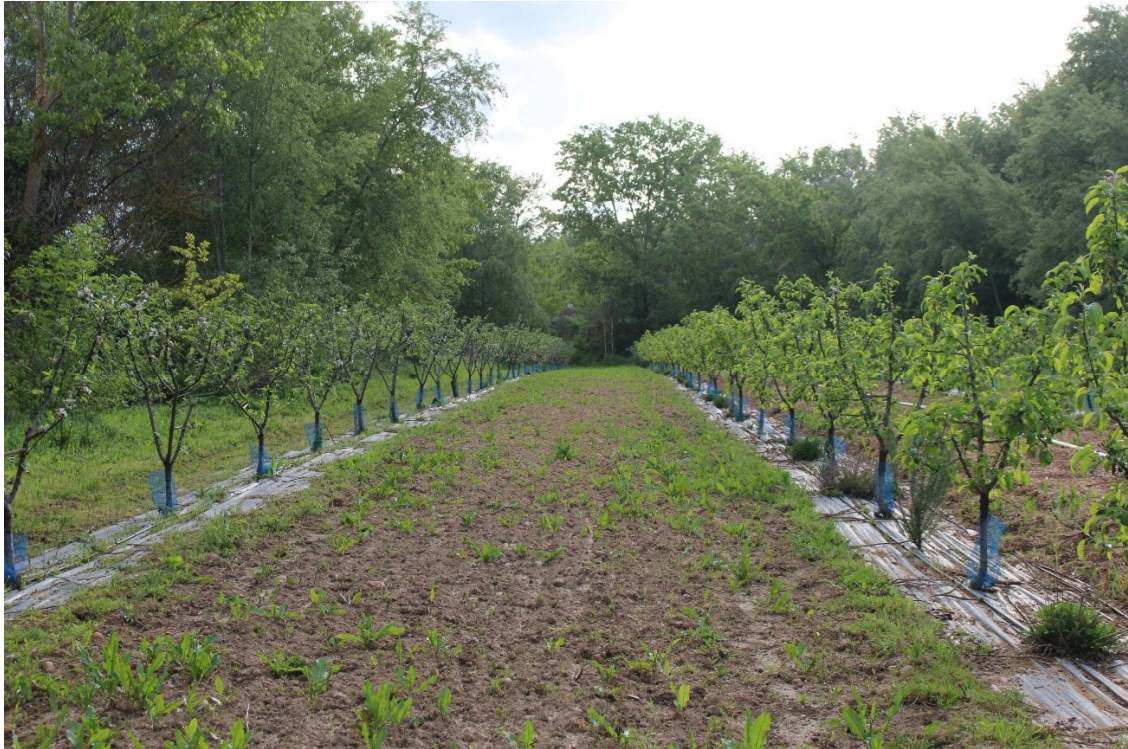
Figura 9. Calle sembrada de trébol. Puede observarse que no tuvo una buena nascencia.

4.- Evolución de la fertilidad y humedad del suelo . Dichos análisis se realizan por el personal de INEA en las propias instalaciones de la finca. La interacción suelo-variedad es compleja y su conocimiento resulta importante para el desarrollo de itinerarios técnicos que permitan la elección de sistemas de cultivo más funcionales y eficientes. Por ello resulta importante contrastar los resultados obtenidos con el método de fertilización orgánica, con la humedad y con la evolución físico-química y biológica del suelo, ya que estas interacciones van a afectar al crecimiento del árbol y su rendimiento productivo, pero también, a la calidad del fruto y al desarrollo de plagas y enfermedades. Esta evolución se analizará a lo largo de los años.