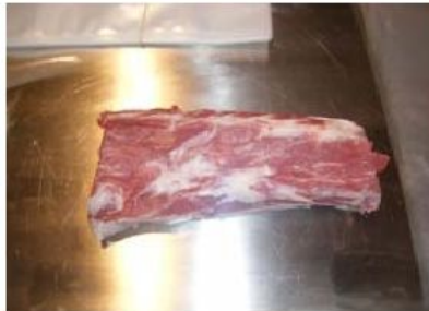
Figura 4.- Porción de carne de Gochu Asturcelta

La valoración sensorial de la carne de Gochu Asturcelta no presentó covariación con los contenidos en ácidos linoleico y linolénico, en concordancia con Ruiz y López Bote (2005). Sin embargo sí se observó un incremento en las puntuaciones (escala 0-5) de calidad del olor (3,97 vs 3,78, p = 0,0629) y del sabor (3,99 vs 3,80, p = 0,0651) frente al régimen semiextensivo, cuando hubo mayor disponibilidad de estrato arbustivo-subarbustivo y de frutos del bosque. (Argentería et al. , 2013).