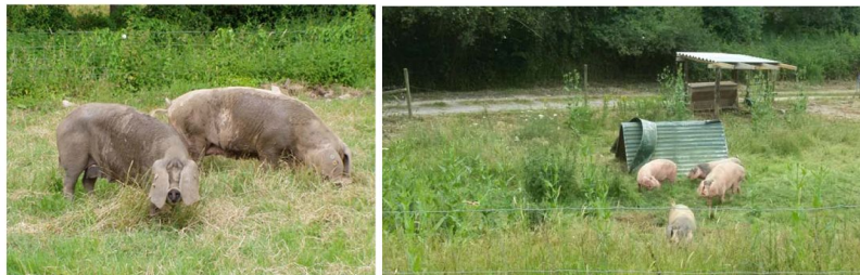
Figura 3.- Producción de Gochu Asturcelta en semiextensivo

Al igual que las demás razas porcinas autóctonas españolas, el Gochu Asturcelta es un animal de perfil lipogénico. A partir del año de edad, la capacidad de síntesis de proteína tisular es muy baja y el aumento de peso equivale casi exclusivamente a deposición de grasa. De ahí que el pienso de acabado tenga muy bajo contenido proteico y en la práctica se utilice una mezcla de cebada y centeno, con adición de lisina y treonina sintéticas, para corregir el déficit de dichos aminoácidos esenciales en los cereales. En animales sacrificados a partir de los 15 meses de edad, el espesor de tocino dorsal es excesivo y el contenido en grasa intramuscular de la carne muy elevado. De ahí la recomendación de sacrificar a un máximo de 13 meses de edad, en que el animal puede alcanzar 150-160 kg de peso vivo (Roza-Delgado et al. , 2010). El rendimiento de la canal se aproxima al 80% y la carne presenta una buena infiltración de grasa (jaspeado) caracterizada por un elevado contenido en ácidos grasos poliinsaturados (Vieira et al. , 2010).