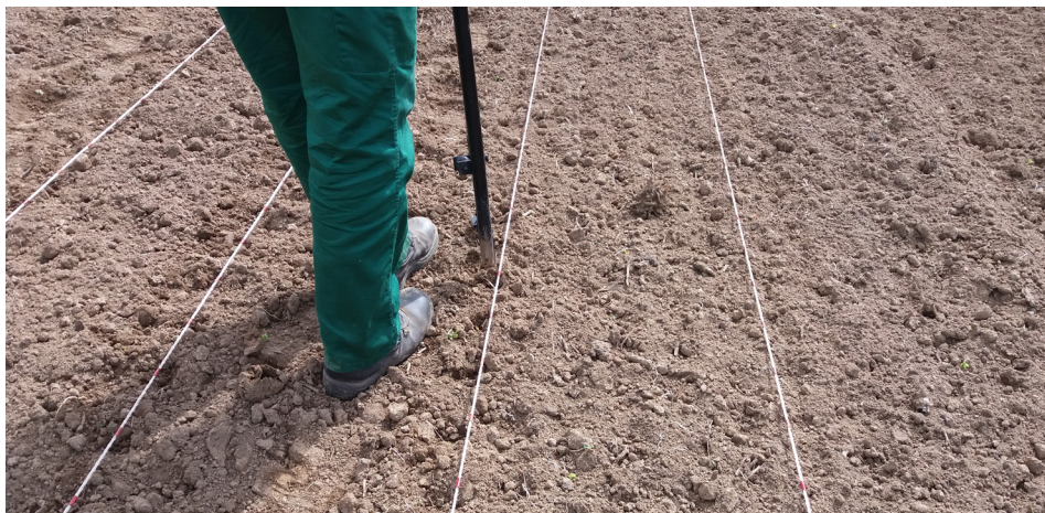
Fotografía 1. Detalle de la siembra manual con bastón en una parcela elemental con las líneas de siembra delimitadas.

La evaluación en cada campo experimental comienza con la preparación del terreno, fertilización, delimitación de parcelas elementales, siembra de las variedades en las mismas y tratamientos fitosanitarios. La siembra se realiza siempre de forma manual (ver fotografía 1) y de forma que las variedades de un mismo ciclo queden agrupadas.