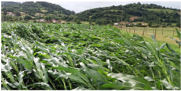
Fotografía 3. Efecto de las fuertes rachas de viento del 28/06/2017 en el campo de evaluación de variedades de la zona interior baja (Grado).

Aunque el viento en general, a lo largo del periodo de crecimiento del cultivo sopló de acuerdo a lo esperado, cabe destacar que durante el mes de junio hubo episodios puntuales con rachas fuertes, llegando a alcanzar los 114 km/h el 28 de junio en la zona costera occidental (observatorio del Cabo Busto, concejo de Valdés). En la fotografía 3, y a modo de ejemplo, se puede observar el efecto que sobre el cultivo de maíz ejercieron dichas rachas de viento, cuando las plantas de maíz ya tenían una altura suficiente como para ser tumbadas sin capacidad de recuperación (ver fotografía 3).