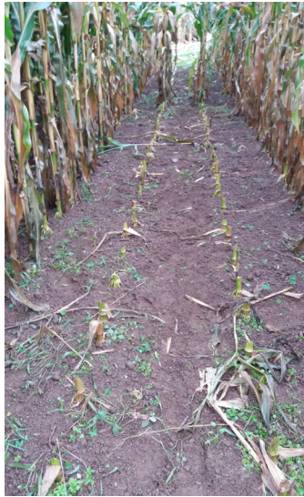
Fotografía 2. Efectividad del herbicida sobre el control de malas hierbas.

Inmediatamente después de la siembra se añadieron los herbicidas e insecticidas convencionales para el cultivo del maíz. La efectividad de los herbicidas se muestra en la fotografía 2.