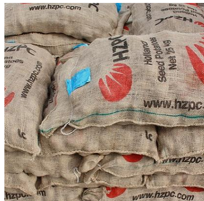
Sacos de patata de siembra certificada