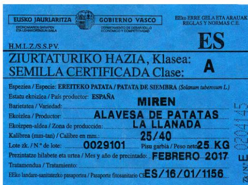
Etiqueta patata certificada origen nacional