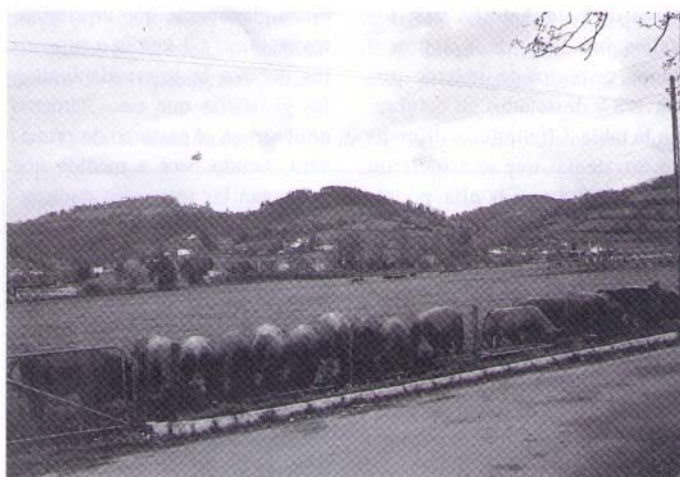
Suplementación de terneros en pastoreo.

De tener interés en el nivel de engrasamiento de los terneros, éste se podría incrementar a niveles similares a los obtenidos en intensivo 2-2,5 con un acabado tras pastoreo de 90-120 días, suministrándoles concentrado a libre disposición. Ello supondría ir a pesos vivos al sacrificio muy altos, de 600 kg o más, y una pérdida de la eficiencia y rentabilidad del sistema. Los pesos al sacrificio también se podrían reducir incrementando la carga animal en el pastoreo, lo que se traduciría en menores ganancias durante el pastoreo y de peso al final del mismo. No obstante ello también supondría una pérdida de rentabilidad del proceso. Por consiguiente, a nuestro juicio deberían de ser acabados a pienso solamente aquellos terneros que al final del pastoreo no han alcanzado el peso de sacrificio propuesto, y aquellos otros cuyas ganancias de pastoreo, en especial en la fase final, fueron inferiores a 1,2 kg/día. La raza Asturiana de los Valles presenta en general niveles de engrasamiento bajos, y en especial los portadores del carácter culón, cuyo nivel de engrasamiento es aún inferior al de los terneros cebados en pasto, sin embargo es conocido, en el sector su estima por los carniceros. Para aquellos consu-