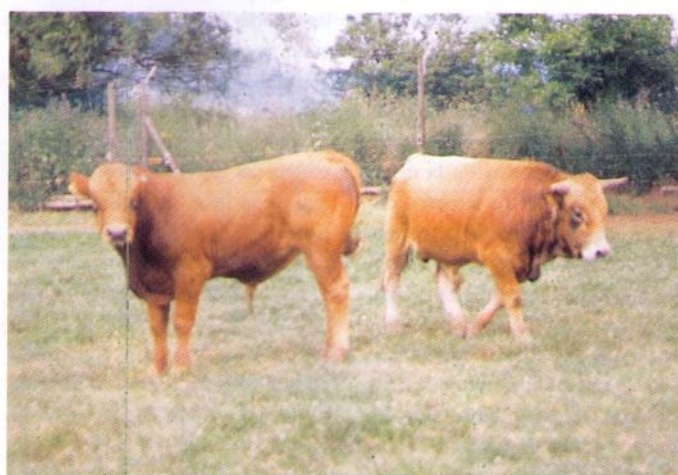
Terneros de ambas razas asturianas cebados en pastoreo.

Alguien podría preguntarse por qué se restringe la alimentación de la invernada y no se aprovecha el máximo potencial de crecimiento del animal en esta época. Los resultados de los trabajos de los años anteriores (1989-91), nos indican claramente que crecimientos en torno a 1 kg/día o superiores durante la invernada limitan las ganancias que estos terneros obtienen en el pastoreo de primavera, siendo peor a medida que aumentan las ganancias de la invernada por encima del kg/día. Esta respuesta inversa en el pastoreo de primavera también puede observarse entre las vacas que salen gordas al pasto y las que salen con condición corporal mediana, en torno a 2,5. Por consiguiente, la restricción de la alimentación durante la invernada persigue incrementar la eficiencia de utilización