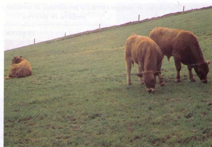
Los terneros nacidos en otoño alcanzan buenos pesos antes de ser destetados tras el pastoreo de primavera.

Es en esta época, en la primavera, cuando en nuestras condiciones se da el mayor crecimiento del pasto, tanto cuantitativa como cualitativamente, alcanzando contenidos en energía por kg de materia seca similares a los concentrados y superiores en el caso de la proteína. El aprovechamiento de estos pastos a diente o en forma de forraje conservado ha sido destinado, principalmente a la producción lechera, en especial en las zonas bajas o costeras. Sin embargo, hoy se han producido cambios importantes en el vacuno lechero, dirigidos en dos sen