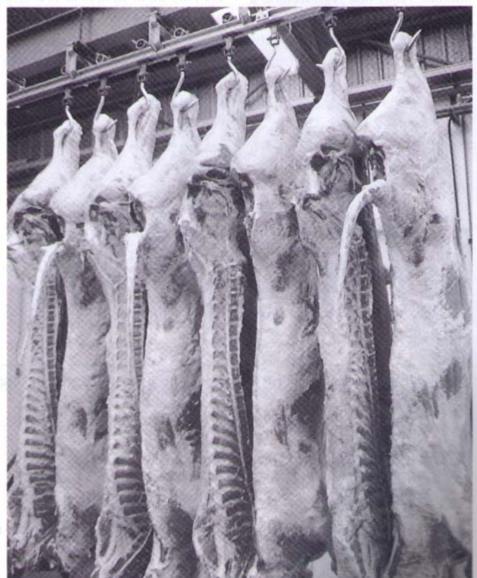
Canales objeto de estudio en matadero.