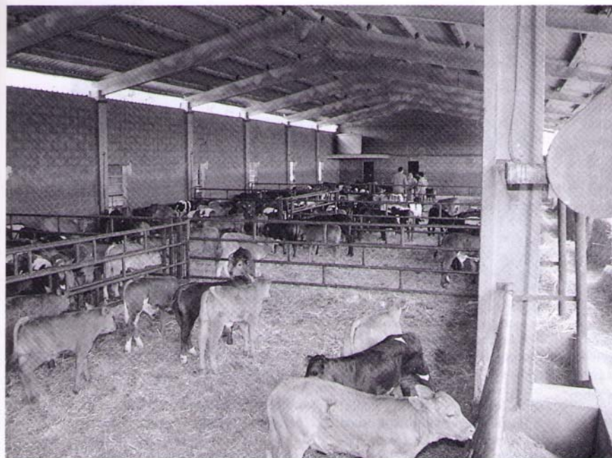
Terneros en cebo intensivo.